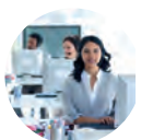
financieel & commercieel